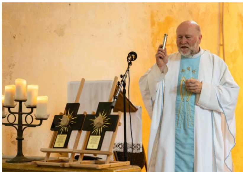
Požehnání křížů s kameny z „rodného domu“ sv. Jana Nep. pro brazilská města

Časopis JOHÁNEK vydává Matice sv. Jana Nepomuckého, Přesaničké nám. 1, 335 01 Nepomuk. Evidenční číslo MK ČR E 24136. Časopis je neprodejný.