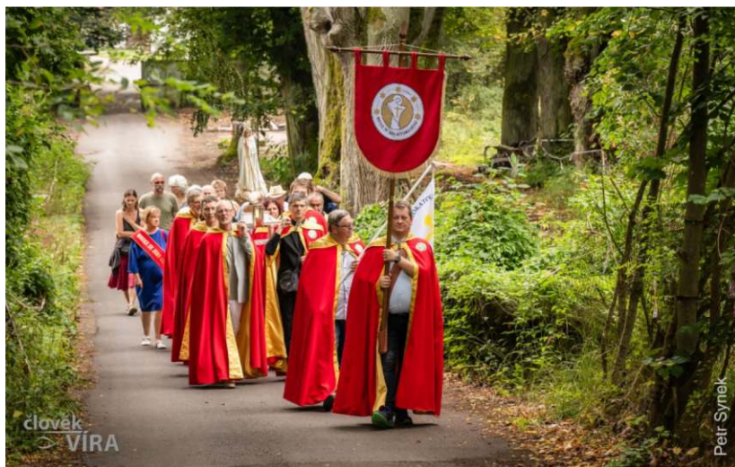
Procesi na Zelnou horu se sochou Panny Marie, vpředu nový prapor Matice sv. Jana Nep.